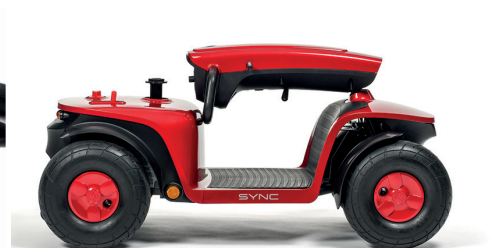
VANO PORTAOGGETTI COMPATTO