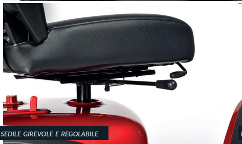
SEDILE GIREVOLE E REGOLABILE