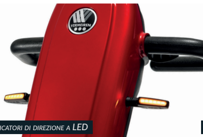
INDICATORI DI DIREZIONE A LED