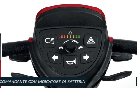
COMANDANTE CON INDICATORE DI BATTERIA