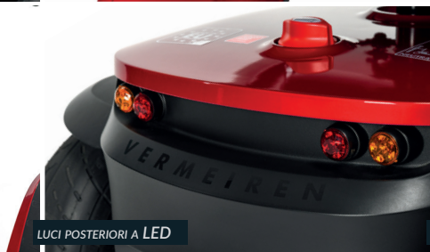
LUCI POSTERIORI A LED