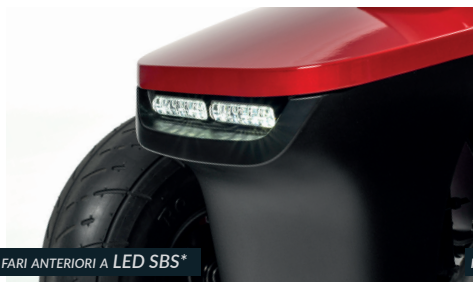
FARI ANTERIORI A LED SBS*