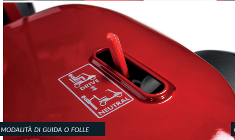
MODALITÀ DI GUIDA O FOLLE