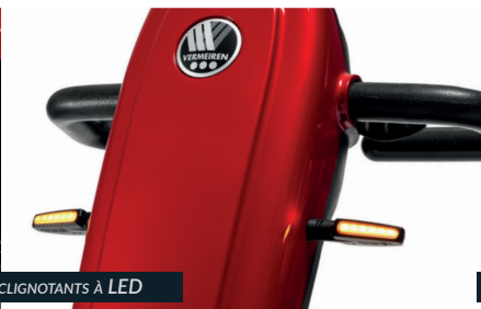
CLIGNOTANTS À LED