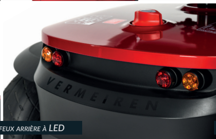
FEUX ARRIÈRE À LED