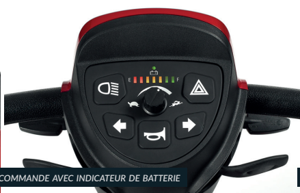
COMMANDE AVEC INDICATEUR DE BATTERIE