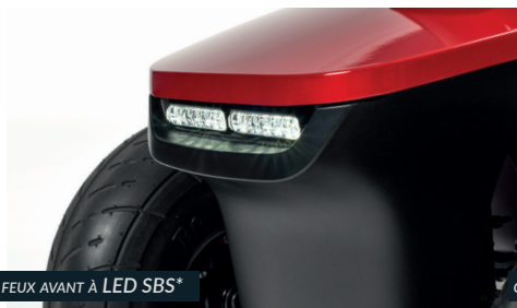
FEUX AVANT À LED SBS*