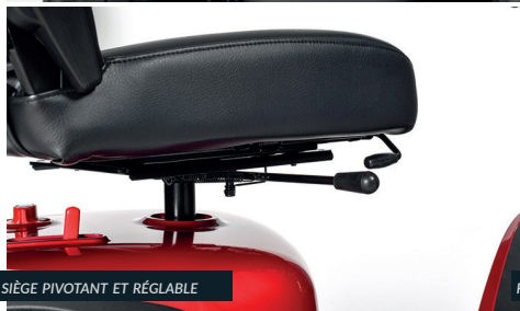
SIÈGE PIVOTANT ET RÉGLABLE