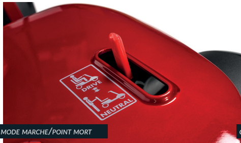
MODE MARCHÉ/POINT MORT